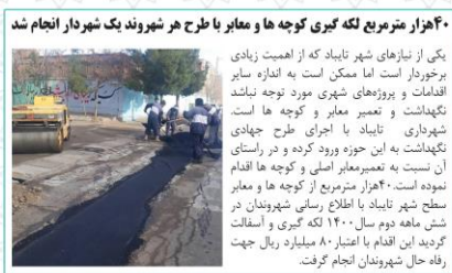
۴ هزار متر مربع لکه گیری کوچه ها و معیار با طرح هر شهروند یک شهردار انجام شد

در دنیای امروز که رسانه های جمعی و فضای مجازی ذهن و روان افراد جامعه را به خود مشغول ساخته و افراد زمان و وقت قابل توجهی در روز را به گفت و گو در فضای مجازی اختصاص می دهند. تأسیس و گذراندن جشن های اجتماعات تجاری به نوبه خود می تواند منتهی به فرار ذهن افراد از فضای مجازی و حضور در محیط اجتماعی گردد. نقش چنین اجتماع هایی برای اوقات فراغت در قیاس با استفاده صرف از فضای مجازی و اسباب های جسمی و روانی ناشی از آن به ویژه برای قشر جوان جامعه که به یکی از هدف ها های بزرگ امروز جامعه تبدیل شده است، گذشت ۲۰ سال شده است. از ابتدای شروع به کار مدیریت شهری دوره ششم روند احداث مجتمع تجاری اداری شهرداری تایباد بعد از وقفه سه ساله آغاز و منجر به افتتاح مجتمع تجاری شهرداری با ۳۱۱ باب مغازه بعد از گذشت ۲۰ سال شده است. قسمت عمده ای از امور عمرانی این مجتمع از جمله سفک کاری سه طبقه قبلاً انجام شده بود و از سال ۱۳۸۴ مطالعات، طراحی و احداث این مجتمع با کاربری تجاری و اداری آغاز و در چند مرحله و هر بار چند سال متوقف شده بود. سالند ماه ۱۴۰۰ و بعد از بررسی و برآورد هزینه ها