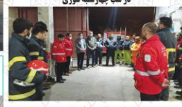
برگزاری مانور زلزله و ایمنی