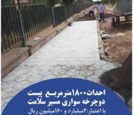
احداث ۱۸۰۰ متر مربع پیست دوچرخه سواری مسو سلامت با اعتبار: ۱۶۰ میلیون ریال