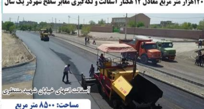
آسفالت کفپوش خیابان شهید منتظری مساحت: ۸۵۰۰ متر مربع اعتبار: ۱۷۰۰۰۰/۰۰۰/۰۰۰ ریال