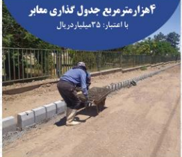
۴ هزار متر مربع جدول کناری معیار با اعتبار: ۳۵ میلیارد ریال