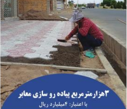
۴ هزار متر مربع پیاده رو سازی معیار با اعتبار: ۴ میلیارد ریال