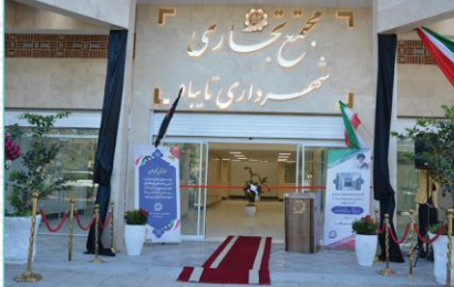
آغاز فاز دوم مجتمع تجاری شهرداری طراحی طبقه دوم به عنوان اقامتگاه

آسفالت معیار و بهبود عبور و مرور معیار شهری جزء فعالیت مهم شهرداری در سال ۱۴۰۱ است که به عنوان یک اولویت مهم در دستور کار قرار دارد. برای عمران و نوسازی معیار و محلات برنامه های مختلفی بر مبنای دستور العمل های تعیین شده در طول سال اجرا شده است. گزارش پیش رو از نیمه دوم سال ۱۴۰۱ (نیمه اول سال ۱۴۰۲) می باشد که اقدامات عمرانی مهمی در قالب روشن، مرتب، نوساز و آسفالت معیار اصلی و فرعی شکل گرفته و امید است موجب رضایت شهروندان قرار گرفته باشد. معمری که بیشترین سطح آسفالت را داشته اند.