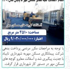
انجام آسفالت کله معیار شهر تا پایان سال ۱۴۰۱ مساحت: ۴۵۱۰ متر مربع اعتبار: ۹۰۰۰۰/۰۰۰/۰۰۰ ریال

آسفالت معیار و بهبود عبور و مرور معیار شهری جزء فعالیت مهم شهرداری در سال ۱۴۰۱ است که به عنوان یک اولویت مهم در دستور کار قرار دارد. برای عمران و نوسازی معیار و محلات برنامه های مختلفی بر مبنای دستور العمل های تعیین شده در طول سال اجرا شده است. گزارش پیش رو از نیمه دوم سال ۱۴۰۱ (نیمه اول سال ۱۴۰۲) می باشد که اقدامات عمرانی مهمی در قالب روشن، مرتب، نوساز و آسفالت معیار اصلی و فرعی شکل گرفته و امید است موجب رضایت شهروندان قرار گرفته باشد. معمری که بیشترین سطح آسفالت را داشته اند.