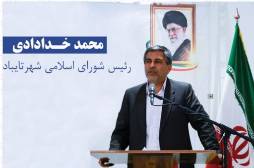
رئيس شورا اسلامي شهر تايباد

در اواين جلسه شورا دوره ششم تعيين تکليف پروژه هاي ناندام يکي از اولويت هاي اعلام شد با توجه به گذشت ۱۳ سال از شروع احداث پروژه مجتمع تجاري شهرداري با پيگيري شهردار طبقه همکف با ۳۱ باب نماز افتتاح و به بهره برداري رسيد. از ايجا که قسمت عمدت درآمد مردم مستفله از امور کشاورزي و دامپروزي آامين مي شود و متأسفانه مشکلات هاي اخير موجب بروز مشکلات عمده اقتصادي براي شهريستان گرديده است لذا مجوز تخفيفات ۳۰ درصدی عوارض نوسازي و پروژه ساختمان و بخشودگي چارم چک هاي برکنش در سه مرحله صادر شد به مناسبت هاي هده مبارک فجر سال ۱۴۰۰ اسان بود در ايام عيد قربان تا عيد غدیر که مورد استقبال شهروندان قرار گرفت.