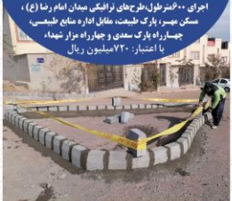
اجرای ۱۰۰ متر طول طرح های ترافیکی میدان امام رضا (ع)، مسکن بهسر، پارک طبیعت، فضای اداره منابع طبیعی، چهارراه پارک سعدی و چهارراه بزاز سعید با اعتبار: ۷۲۰ میلیون ریال